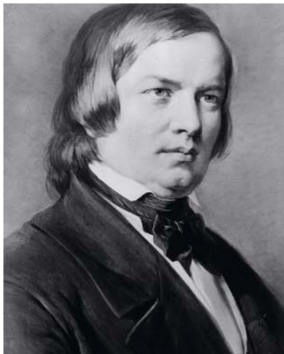
Robert Schumann 1850

die Umrisse eines großangelegten musikalisch-pädagogischen Konzepts, das eine Seite des politisch-sozialen Engagements Schumanns darstellt... Unter der Devise der allgemeinen Verständlichkeit und höchstmöglichen Wirksamkeit der Musik in der gesellschaftlichen Realität nähern sich die spä-